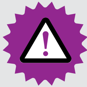
Omgaan met calamiteiten