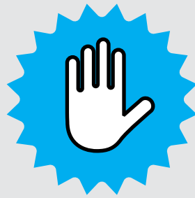
Seksuele Intimidatie en Seksueel Geweld (SISG)