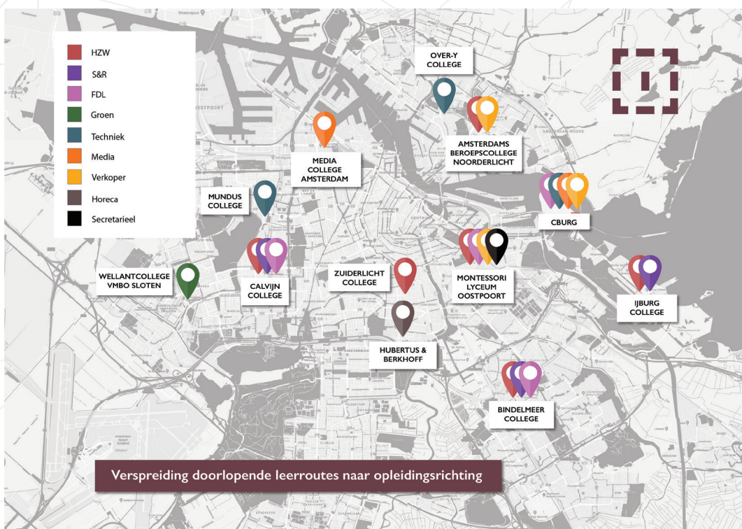
Figuur 3 Verspreiding doorlopende leerroutes naar opleidingsrichting, schooljaar 2020-2021.