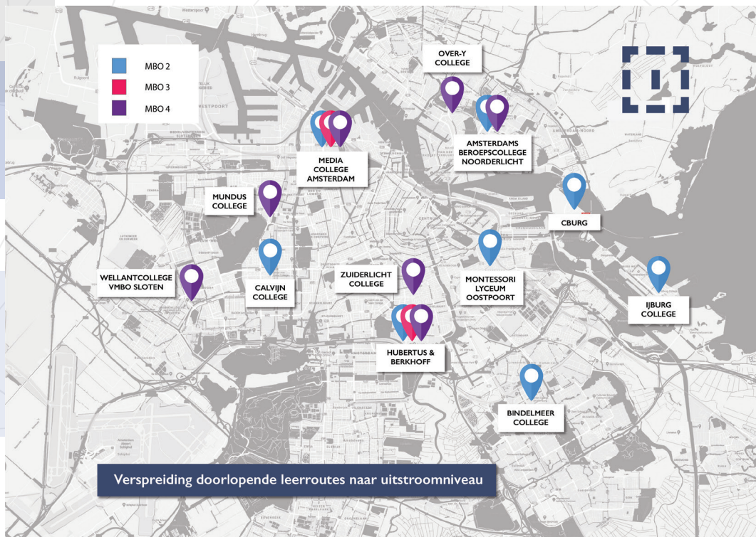
Figuur 2 Verspreiding doorlopende leerroutes naar uitstroomniveau, schooljaar 2020-2021.