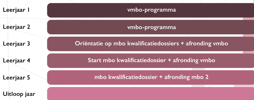
Figuur 4 Opbouw onderwijsprogramma geïntegreerde leerroutes.

Het aanbieden van een volledig gezamenlijk curriculum is lastig te realiseren. Toch bieden in Amsterdam vo-scholen en mbo-instellingen vooral deze geïntegreerde variant aan. Het onderwijsprogramma binnen deze leerroutes kent een gelijke opbouw. Leerlingen benutten leerjaar 3 als een oriënterend jaar. Daarna maken leerlingen de keuze om wel of niet in te stromen in de doorlopende leerroute en/of welke specifieke uitstroomrichting ze gaan volgen. Waar mogelijk ronden de leerlingen in dit leerjaar hun vmbo-vakken af. Het overige vmbo-programma ronden de leerlingen in leerjaar 4 af. Ook krijgen de leerlingen vanaf leerjaar 4 het mbo-curriculum aangeboden. In leerjaar 5 ronden de leerlingen hun mbo-opleiding af. De opleiding stimuleert en begeleidt de leerling bij het maken van een vervolgstap. Leerlingen lopen zowel in leerjaar 4 als 5 kwalificerende stages.