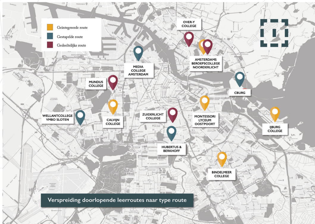
Figuur 1 Verspreiding doorlopende leerroutes naar type route, schooljaar 2020-2021.